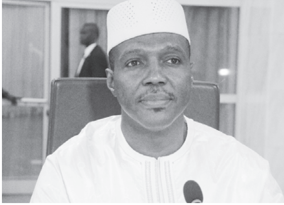
Le Président de la Transition (d) demande au gouvernement de veiller à une gestion rigoureuse des ressources de l'État en renforçant les mécanismes de contrôle de la gestion des finances publiques

En premier lieu, le Chef de l'État a instruit le gouvernement de renforcer les actions dans les domaines de la défense et de la sécurité. Selon lui, les forces armées et de sécurité constituent le rempart pour l'intégrité et la stabilité de l'État. Et dans le même temps, la sécurité est le gage pour tout développement et toute vie harmonieuse en société. « Les efforts déployés pour renforcer les forces armées et de sécurité en termes d'équipements, de formation et